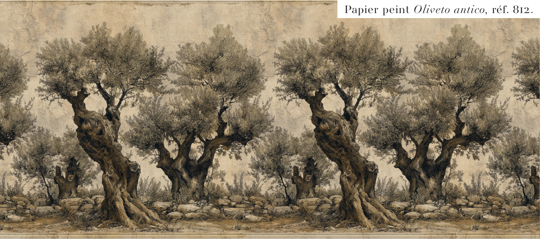
Papier peint Oliveto antico , réf. 812.