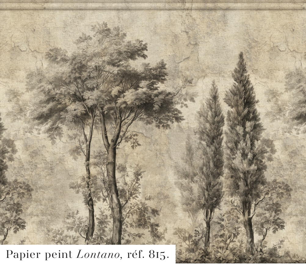
Papier peint Lontano , réf. 815.