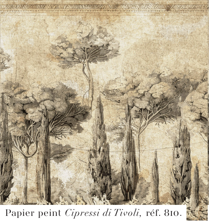
Papier peint Cipressi di Tivoli , réf. 810.