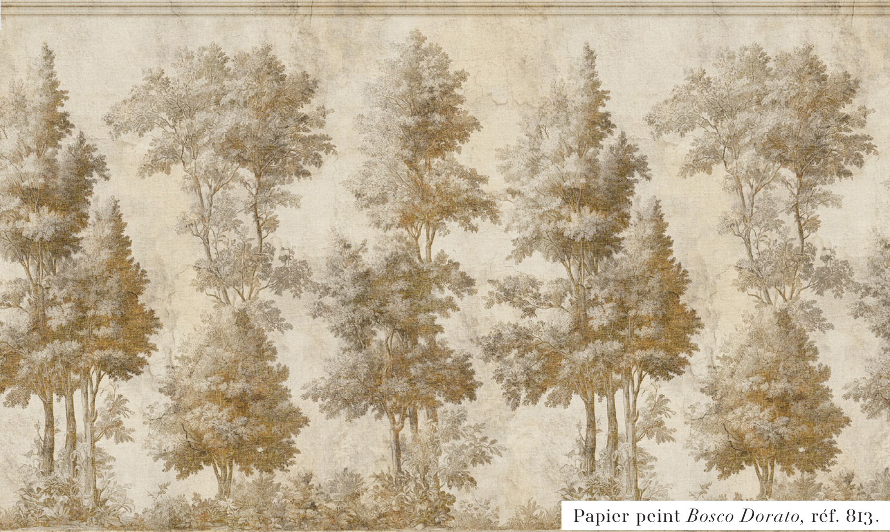
Papier peint Bosco Dorato , réf. 813.