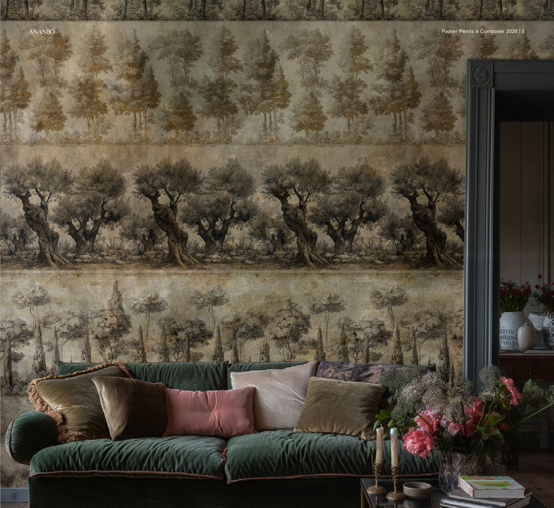
Papier peint à composer Oliveto antico , Bosco Dorato et Cipressi di Tivoli , Collection Italienne (réf. 810, 812 et 813).

Dans une maison ancienne ou un espace minimaliste, ils accompagnent l'architecture sans la contraindre. Les intérieurs gagnent en calme, en rythme, en élégance silencieuse.