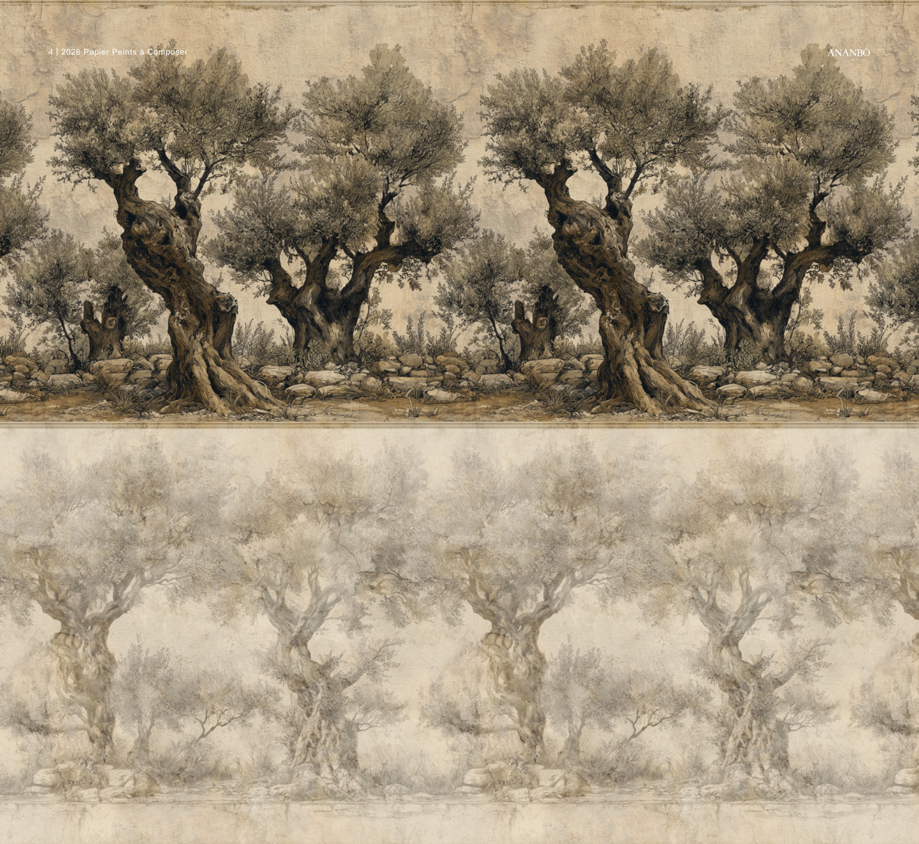
Papier peint à composer Oliveto et Oliveto antico , Collection Italienne (réf. 811 et 812).