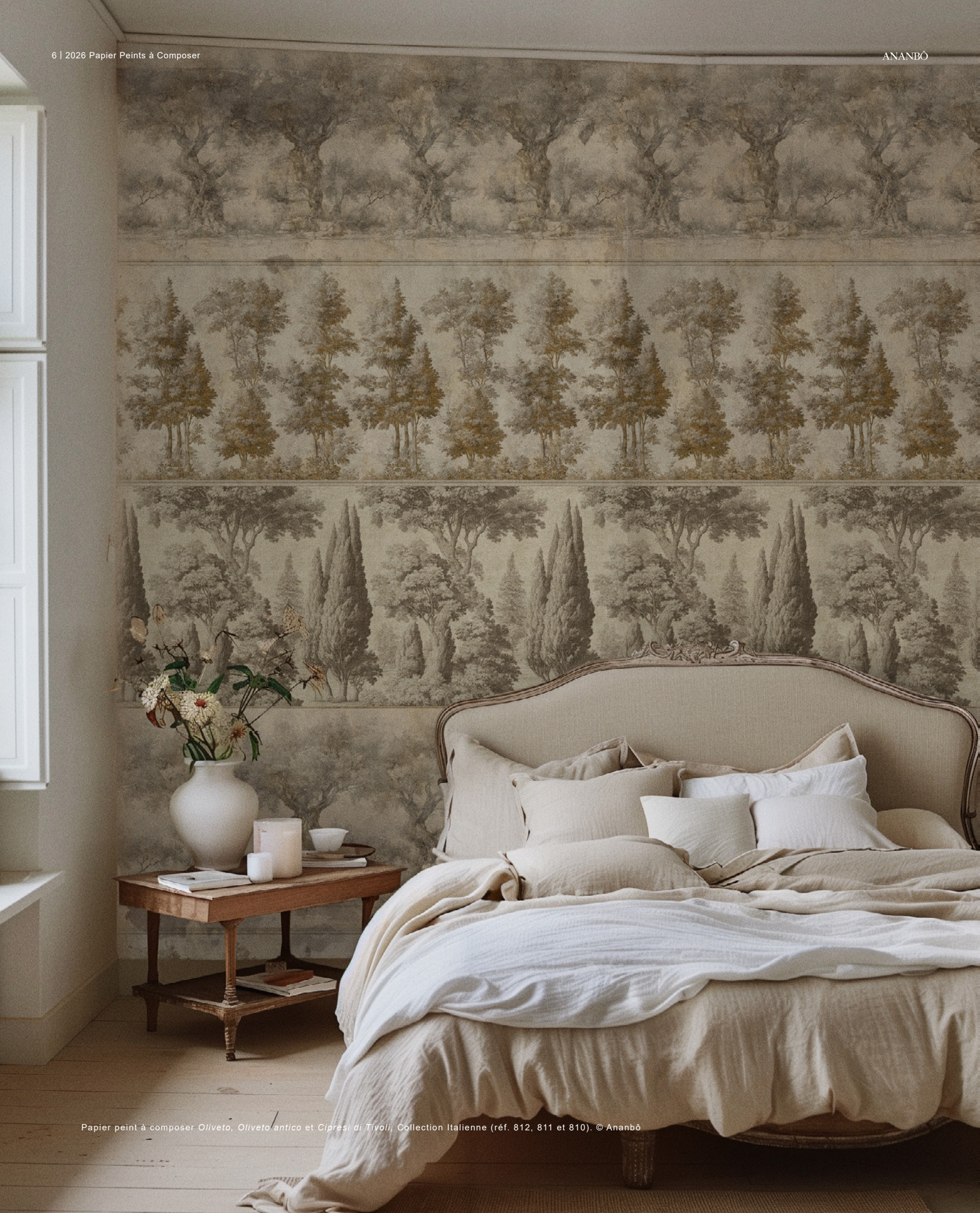
Papier peint à composer Oliveto , Oliveto antico et Cipresi di Tivoli , Collection Italienne (réf. 812, 811 et 810).