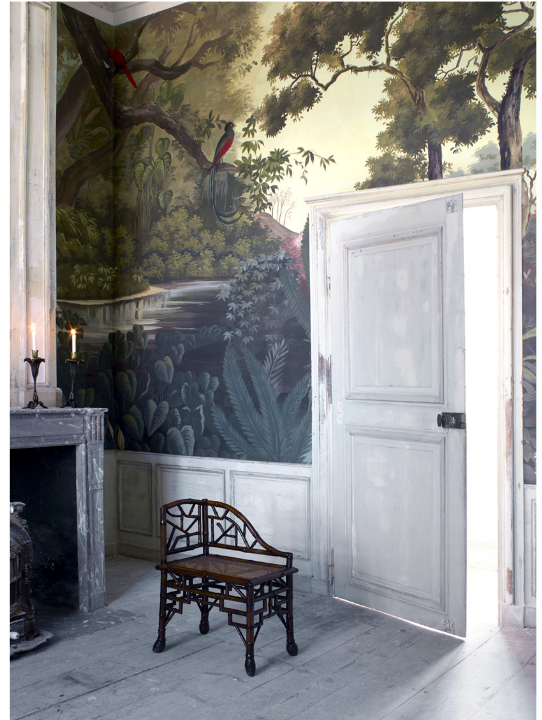
Papiers peints © Ananbô. © Dessins : A. Boghossian. © Direction artistique : S. Doukhan.