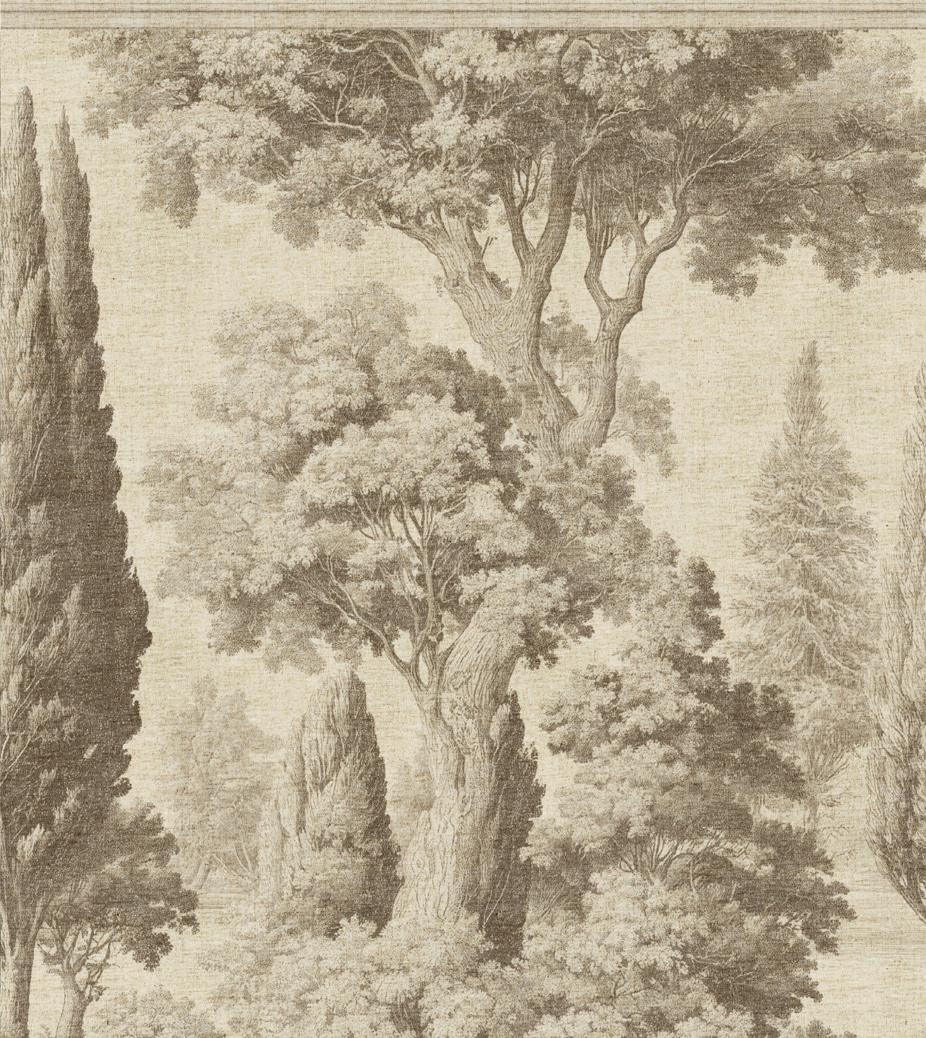
Papier peint Orizzonte , réf. 814.