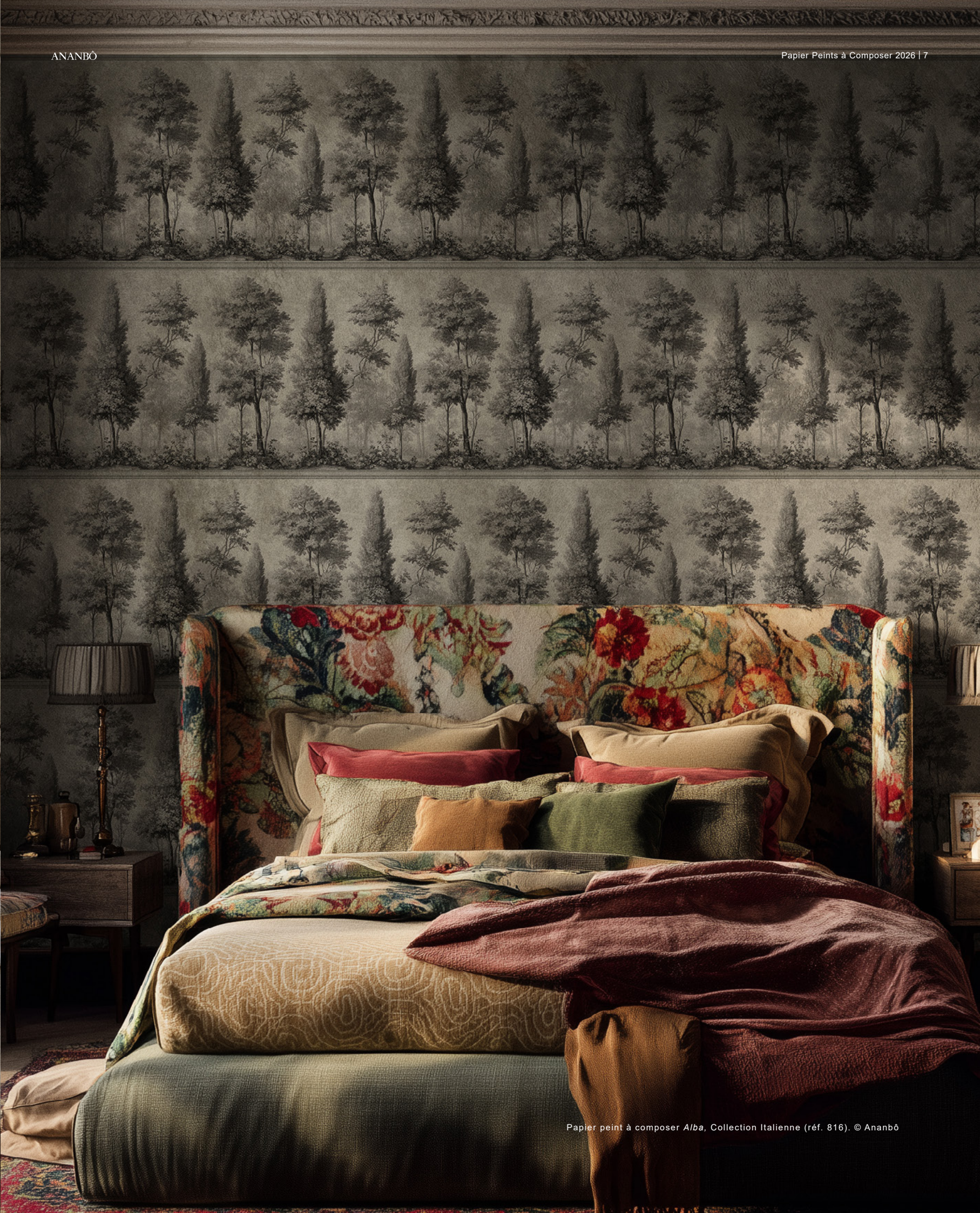
Papier peint à composer Alba , Collection Italienne (réf. 816).